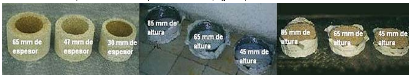
Fig. 1. Casquillos utilizados en el ensayo (izquierda), aros vacíos para colocar la capa de cobertura (al centro) y aros llenos con cáscara de arroz para servir como cobertura (derecha).

Para evaluar el efecto termoaislante de la cáscara de arroz (en forma de casquillos y de cobertura) se utilizó el método de vertido del líquido residual. El mismo consiste en colocar en un molde giratorio los casquillos (de 200 mm de diámetro interior), unidos a un sistema de alimentación que garantiza su llenado simultáneo desde abajo (sifón). Inmediatamente después de verter el acero, se colocó sobre cada probeta un aro con la altura planificada de la capa de cobertura (Figura 1).