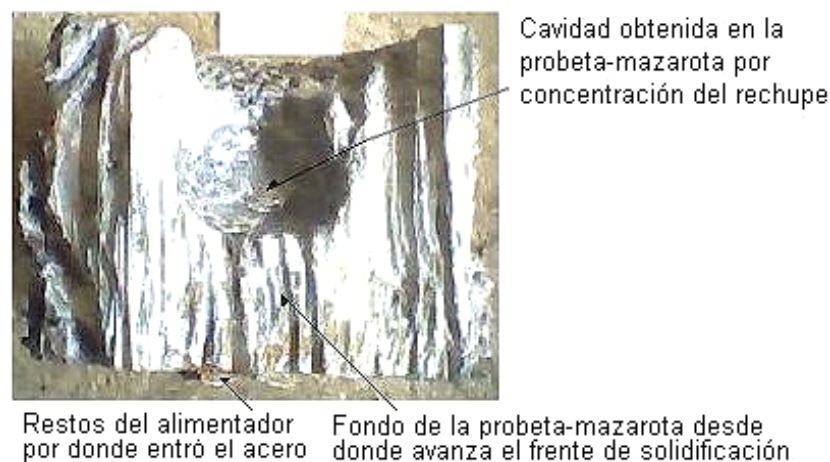
Fig. 3. Sección longitudinal de una probeta-mazarota. Tiempo de solidificación = 15 minutos, espesor de pared del casquillo = 47 mm y espesor de cobertura = 65 mm

En cuanto al por ciento de volumen de entrega, los resultados fueron contradictorios, ya que se obtuvieron valores inferiores a 14 % (exceptuando dos corridas experimentales), magnitud reportada para mazarotas en arena y sin cobertura. Entre otros factores, incidió sobre este resultado el hecho de que el fondo de la probeta-mazarota no se encontraba en contacto con el material termoaislante estudiado. En la caja donde se fundieron las probetas, los casquillos se colocaron sobre un macho de arena sílice que tapa el canal principal del sistema de alimentación y contiene un agujero por donde entra el acero a su cavidad. Cuando el acero líquido hace contacto con este material pierde más calor que en las zonas del casquillo y la cobertura, formándose un frente de solidificación que asciende (actúa como un enfriador). En el corte longitudinal de las probetas-mazarota (Figura 3) se observó una capa solidificada en el fondo, con un espesor aproximadamente tres veces mayor que el presentado por las paredes de la probeta mazarota y un engrosamiento de la pared lateral a partir de dicha capa. Este fenómeno repercute en la disminución de la cavidad obtenida al vaciar el acero líquido, parámetro utilizado para determinar el volumen de entrega. También, probablemente influyeron sobre el volumen de entrega imprecisiones en la medición de la temperatura de vertido.